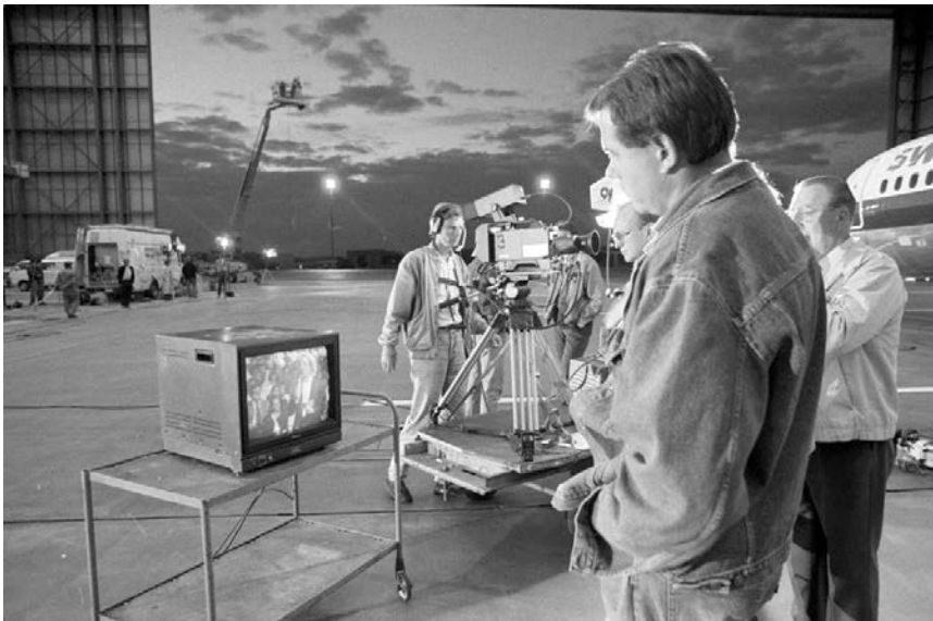
"Wetten, dass ..?" 3. September, Werft Wette Neu: Fernsehendung "Wetten, dass..." in der Werft am Flughafen Zürich-Kloten, 03.9.1988