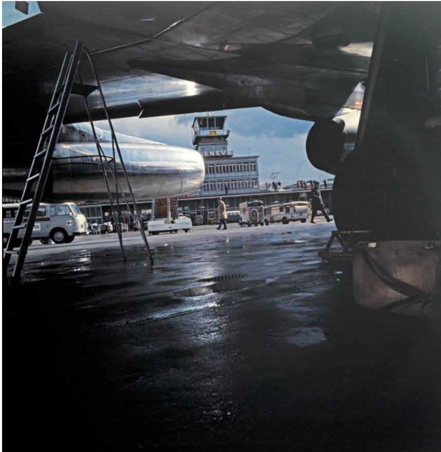
Flughafen Genf : Tarmac Neu: Convair CV-990 Coronado der Swissair auf dem Flughafen Genf-Cointrin, ca. 1953