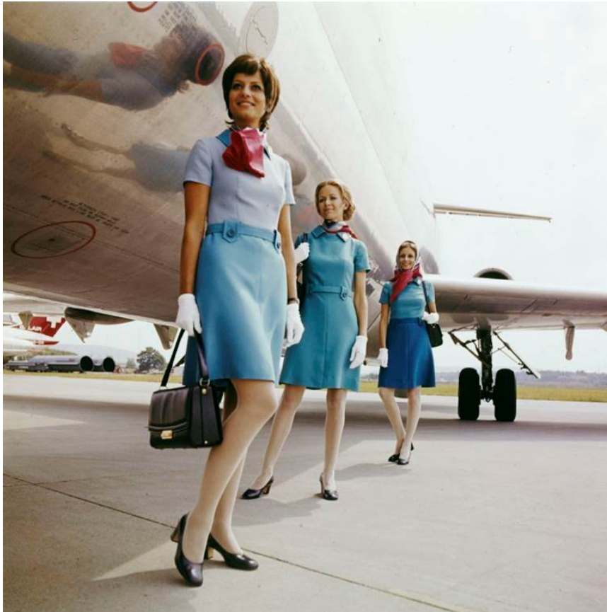
Uniform FA 1960 bis 1970 Neu: Hostessen der Swissair in der von 1970 bis 1977 getragenen Uniform