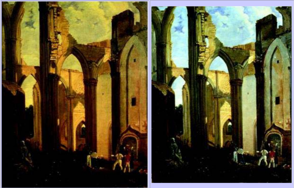
Duellszene vor Kirchenruine (Wilhelm Meyer)

Wasserdampf trübe Stellen entstehen können. Naturstoff-Firnis sollte ausserdem einen Lichtbrechungsindex aufweisen, welcher nahe an demjenigen des Bindemittels der Malschicht liegt, um Lichtstreuungen zu begrenzen, die das Gemälde trübe erscheinen lassen.