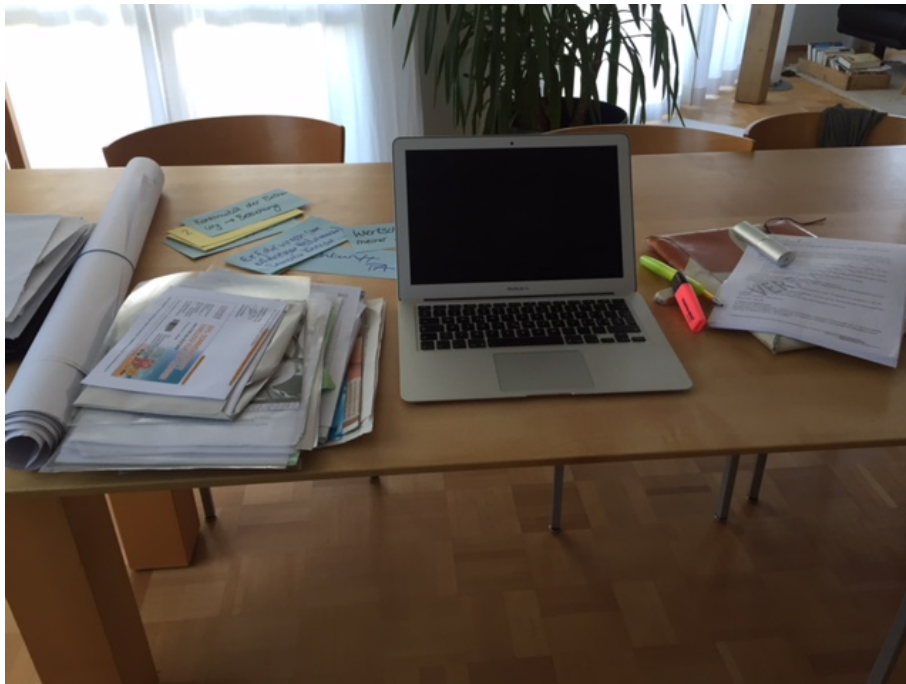
Abb. 2: Lieblingsarbeitsplatz eines Befragten

Die Variante 2 zeigte, wie die Nutzer ihre Arbeitsplätze am liebsten mögen. Grosse Flächen und viel Licht sind dabei die Hauptaspekte, damit sich die Nutzer wohlfühlen. Gerade an einem Ort, wo mehrere Menschen anwesend sind, scheinen Rückzugsmöglichkeiten wichtig zu sein.