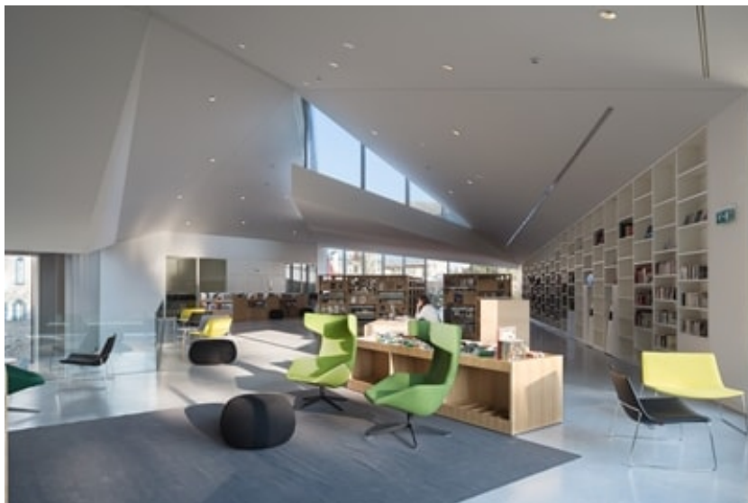
Abb. 3: Beispielbild 14 Variante 3

Es zeigte sich, dass eine Bibliothek verschiedene Bereiche mit spezifischen Funktionen haben sollte. In einem ruhigen Bereich sollte es abgegrenzte Arbeitsplätze geben sowie eine gemütliche Sitzecke mit Sesseln, wo man sich setzen und in Ruhe lesen kann. In einem anderen Bereich, wo man auch sprechen darf, sollen grosszügige Gruppenarbeitsplätze sein.