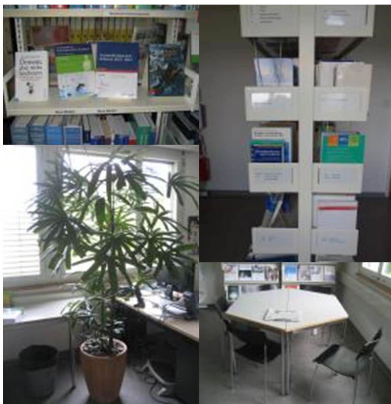
Abb. 1: Zwei positive (links) und zwei negative (rechts) Details

Dennoch sollte man die positiven Rückmeldungen nicht ausser Acht lassen. Es gab Aspekte, die die Befragten sehr schätzten. So zum Beispiel die Präsentation der Zeitschriften und Neuerscheinungen oder die Atmosphäre schaffende Grünpflanze.