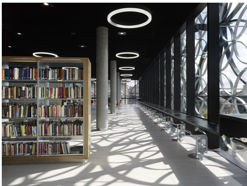
Abb. 4: Beispielbild 15 Variante 3

Anklang fanden vor allem Bilder von Bibliotheksräumen mit viel Licht oder grossen Arbeitsflächen wie bei den Abbildungen 3 und 4. Die Räume, die Gefallen fanden, waren alle mit verschiedenen Materialien ausgestattet: Teppiche, Holz, Metall, Betonmauerwerk und Kunststoff scheinen sich so zu ergänzen, dass dies einladend auf die Betrachter wirkt.