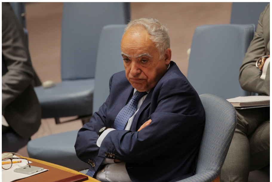
L'envoyé de l'ONU en Libye, Ghassan Salamé, assiste à une réunion du Conseil de sécurité de l'ONU le 21 mai 2019, après des semaines de conflit intense à Tripoli.

Si les violences venaient à s'intensifier et à s'étendre en dehors de la région de Tripoli, cela pourrait avoir des conséquences en Libye, mais aussi dans les pays voisins et en Europe. Le déficit de gouvernance qui se creuse au niveau national pourrait renforcer le pouvoir de l'État islamique, qui a déjà lancé une insurrection dans le sud-ouest du pays. Les passeurs de clandestins pourraient, eux aussi, intensifier leurs activités, ce qui conduirait un nombre croissant de migrants et de réfugiés à tenter la périlleuse traversée de la Méditerranée.