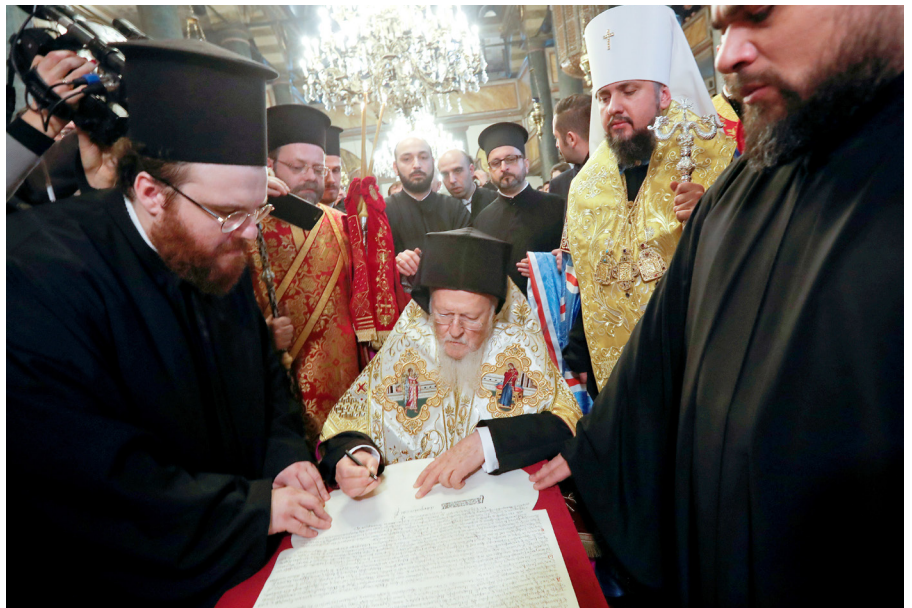
Bartholomäus I., der Ökumenische Patriarch von Konstantinopel, unterzeichnet das Dekret (Tomos) über die Autokephalie der Orthodoxen Kirche der Ukraine am 5. Januar, 2019.

Inmitten dieses komplexen politischen Konflikts tauchte eine historische Forderung nach einer von der Russisch-Orthodoxen Kirche (ROK) unabhängigen, ukrainischen orthodoxen Kirche wieder auf. Im Januar 2019 gewährte der Ökumenische Patriarch von Konstantinopel – primus inter pares orthodoxer Kirchenoberhäupter – der Orthodoxen Kirche der Ukraine