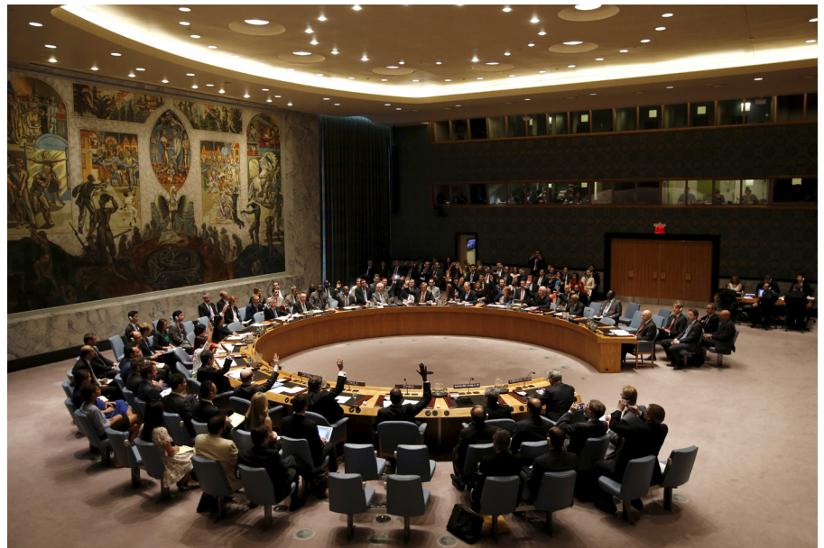
Der UNO-Sicherheitsrat stimmt am 20. Juli 2015 im UNO-Hauptquartier in New York über eine Resolution zum iranischen Nuklearprogramm ab.

Der Bundesrat sieht darin eine konsequente Fortsetzung des bisherigen internationalen Engagements der Schweiz. Durch einen Sitz im Sicherheitsrat verspricht sich die Landesregierung, das internationale Umfeld besser mitgestalten und den verfassungsgemässen Zielen der Wahrung der Unabhängigkeit und Sicherheit der Schweiz sowie der Förderung einer gerechteren und friedlicheren internationalen Ordnung zuarbeiten zu können. Die Schweiz hat gute Chancen, die für 2022 angesetzte Wahl zu schaffen. Innenpoli-