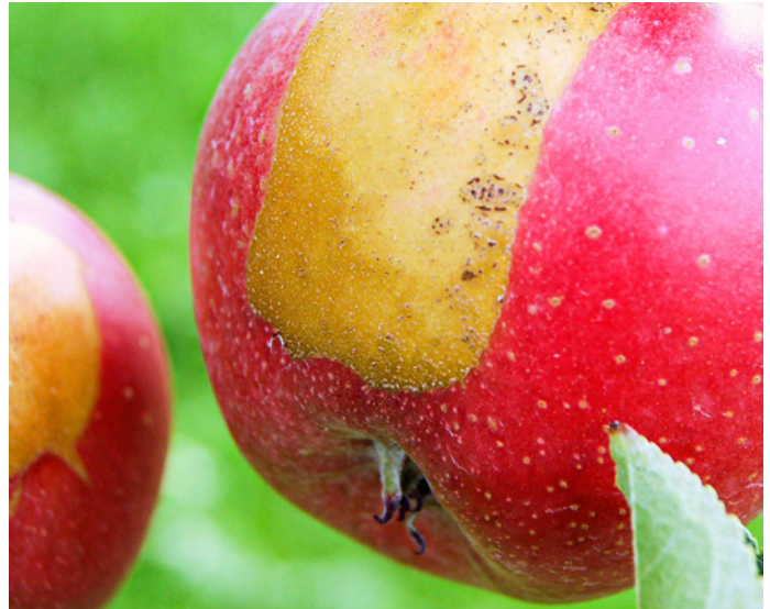
Abb. 1: Apfel mit Frostzungen.

schädliche Hitzetage im Sommer oder günstige Winterfröste ausserhalb der Blüte.