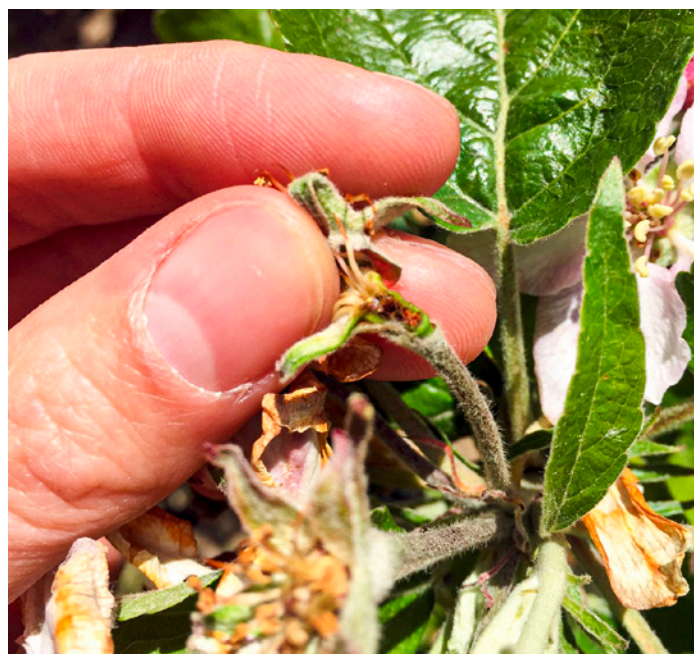
Frostbedingte Schäden auf Apfelblüte.

Die Ergebnisse zeigen, dass Spätfröste sowohl die Quantität als auch die Qualität der Apfelproduktion signifikant beeinflussen, d.h. Spätfröste reduzieren den durchschnittlichen Produzentenpreis pro Quartier und Sorte stark. Der Qualitätseffekt ist wirtschaftlich relevanter als der Effekt auf die Menge. Abbildung 2 wurde mithilfe von Regressionsmodellen basierend auf den erhobenen Daten erstellt. Sie zeigt, dass pro Stunde bei einer Frosteinwirkung von -4^{\circ}\text{C} eine Verminderung des durchschnittlichen Produzentenpreises von knapp 2% als Abweichung zum langjährigen Preismittel des Sortenquartiers und zu allen anderen Preisbeobachtungen im