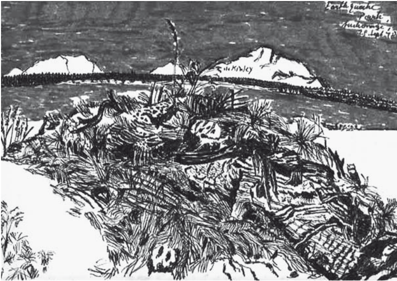
Abb. 4: Zeichnung des Earthquake Park und des Mount McKinley, Anchorage, in: Handke: Die Vorzeitformen , Notizbuch, 128 Seiten, 31.8.1978–18.10.1978, Kopie, Eintrag vom 29.9.1978, DLA, A: Handke, Peter, Notizbuch 16, S. 82. 84

gegangen werden kann, dass die Zeichnungen häufig »zentrale Vorarbeiten für [Handkes] Werke« 83 darstellen, mag die Zeichnung des Earthquake Park beziehungsweise deren erzählerische Transkription den Blick auf einen poetologischen Kern des Textes eröffnen. Für eine solche mögliche Lesart der Episode spricht auch, dass der Erdbeben beziehungsweise die Bruchstelle ein in Handkes Werk häufig herangezogenes Bild ist, das auf die Machart des Textes rekurriert. 85 In Die Lehre der Sainte-Victoire , dem