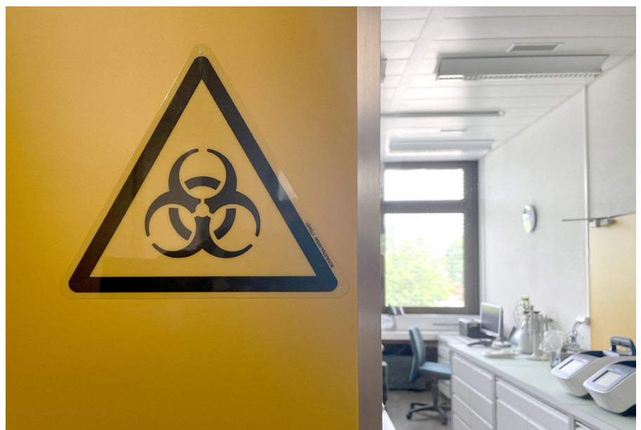
Un panneau de danger biologique est affiché dans l'installation de confinement biologique du laboratoire de Spiez, en Suisse, en juin 2022.

La Convention sur l'interdiction des armes biologiques (CAB), entrée en vigueur en 1975, interdit toute une catégorie d'armes de destruction massive. Or, à l'époque de la création de l'accord, l'Union soviétique n'autorisait aucune mesure visant à contrôler le respect des traités sur son sol. Même si la CAB constitue une norme internationale importante dans la lutte contre les armes biologiques, l'absence de dispositif de vérification efficace lui ôte de ce fait une grande partie de son poids. Cette faiblesse est aujourd'hui d'autant plus criante que les progrès fulgurants réalisés dans le domaine des sciences de la vie pourraient faire émerger des connaissances et des compétences détournables à des fins militaires. En outre, on observe une convergence croissante de disciplines telles que la biologie et la chimie. Contrairement à la CAB, la Convention sur les armes chimiques (CAC) est dotée depuis 1997 d'éléments de vérification efficaces et d'une organisation propre chargée de faire respecter l'interdiction des armes chimiques. Ce fossé entre les dispositifs de contrôle de la CAB et de la CAC pourrait poser un problème croissant. Lors de la neuvième conférence d'examen de la CAB, clôturée en décembre 2022, les États parties ont convenu d'élaborer, si possible d'ici 2025, des mesures pour renforcer efficacement la CAB sur tous ses aspects – une décision qui se révèle bienvenue au regard du contexte.