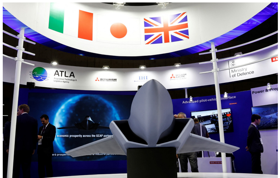
Un modèle conceptuel de l'avion de combat GCAP (Global Combat Air Programme) présenté au salon de la défense DSEI Japan à Tokyo en 2023.

Différents termes sont utilisés pour décrire la coopération entre les régions euroatlantique et indopacifique (voir le CSS Strategic Trends 2022). Les rapports et les analyses font souvent référence à la coopération «interrégionale» ou «Atlantique-Pacifique», ainsi qu'à l'idée que les frontières géopolitiques s'estompent au profit d'un «seul théâtre» ou d'un «théâtre unique». Du point de vue de la politique étrangère américaine, la coopération entre les régions euroatlantique et indopacifique est notamment