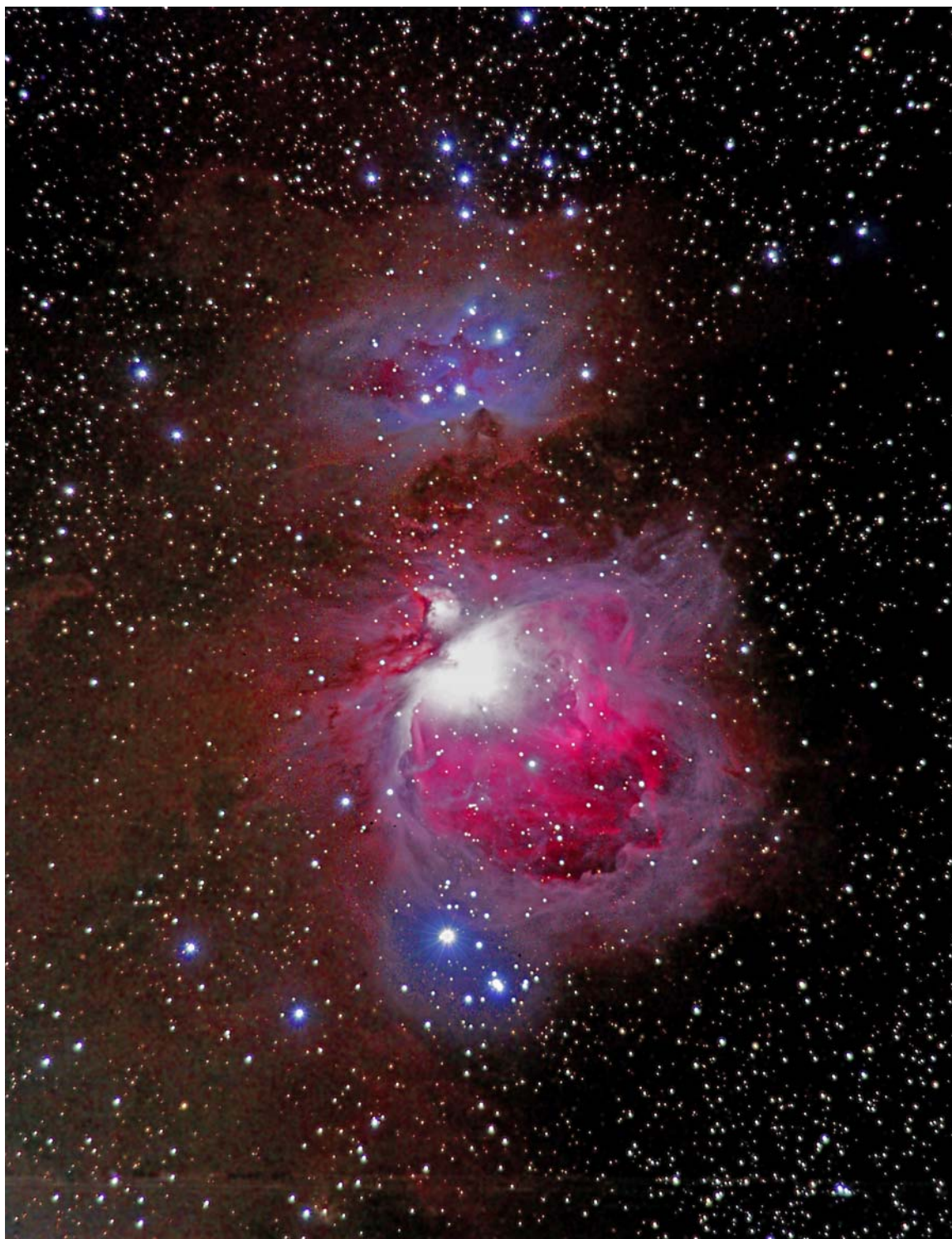
Ein farbenprächtiges Gebilde am Sternenhimmel: der Orion-Nebel (M42). Er wurde im Winter 2009 mit einer modifizierten (rotempfindlich gemachten) Canon 40D fotografiert. Belichtung: rund 3 Std., nachgeführt.

Warum gibt es in der christlichen Zeitrechnung kein Jahr Null?