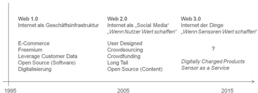
Abb. 1 Internet-Wellen und daraus neu entstandene digitale Geschäftsmodellmuster