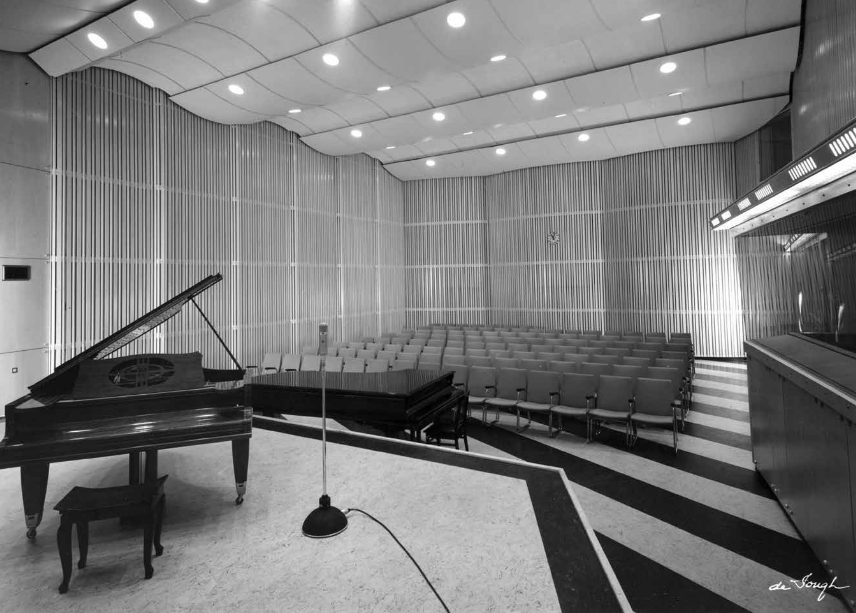
Abb. 4 Studio 5 für Unterhaltungsmusik, Jazz und Varietés mit 150 Sitzplätzen, rechts im Bild die Regie mit Fenster. 1955.