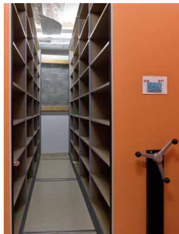
Abb. 8 Compactus-Anlage P52 im Archiv der RTS Lausanne, La Sallaz. Die Archivräume befanden sich in einem ehemaligen Studio und wurden 2025 für den Auszug des Radios aus dem Gebäude geleert. Onlinekatalog der Universität Lausanne, https://catima.unil.ch/rts-studio