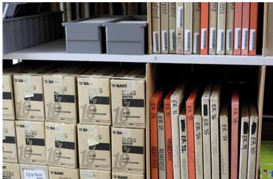
Abb. 7 Datenträger im Archiv der RTS Lausanne, La Sallaz, vor dem Umzug 2025/26. Foto Ariel Huber. Onlinekatalog der Universität Lausanne, https://catima.unil.ch/rts-studio