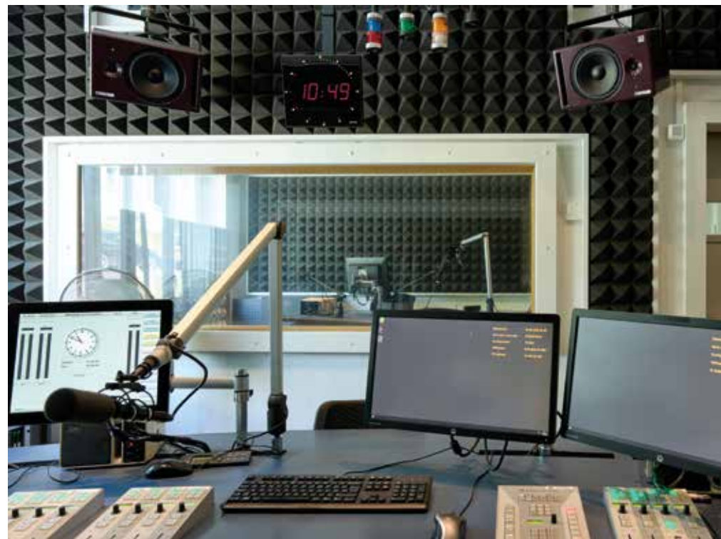
Abb. 6 Blick von der Regie in ein Studio, Lausanne, La Sallaz, im Sommer 2025.