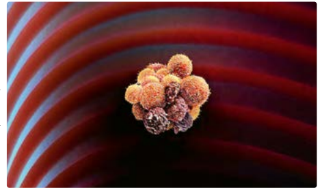
Der Wirkstoff Digoxin kann Häufchen von Krebszellen, die im Blut zirkulieren, auflösen.