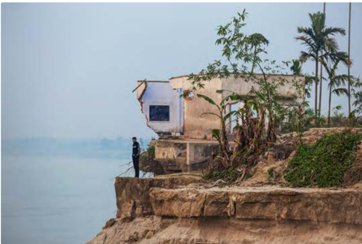
Der Fluss Jamuna in Bangladesch schwillt während des Sommermonsuns immer stärker an, überschwemmt das Delta und erodiert die Flussufer.

Video (in Englisch) «Eroding Horizons. A Village on the Move» → youtu.be/d44LCujw6pk