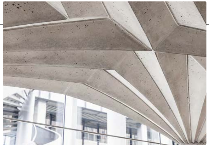
Diese Gewölbedecke aus unbewehrtem Beton entstand mit der neuartigen Schalung «Unfold Form».

Lotte Scheder-Bieschin, Architektur-Doktorandin der ETH Zürich, hat ein faltbares Schalungssystem entwickelt, das bei der Herstellung wenig Ressourcen braucht und wiederverwendet werden