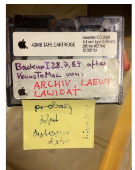
Fig. 2. Beispiel eines durch Materialalterung beim Leseversuch zerstörten Datenträgers.