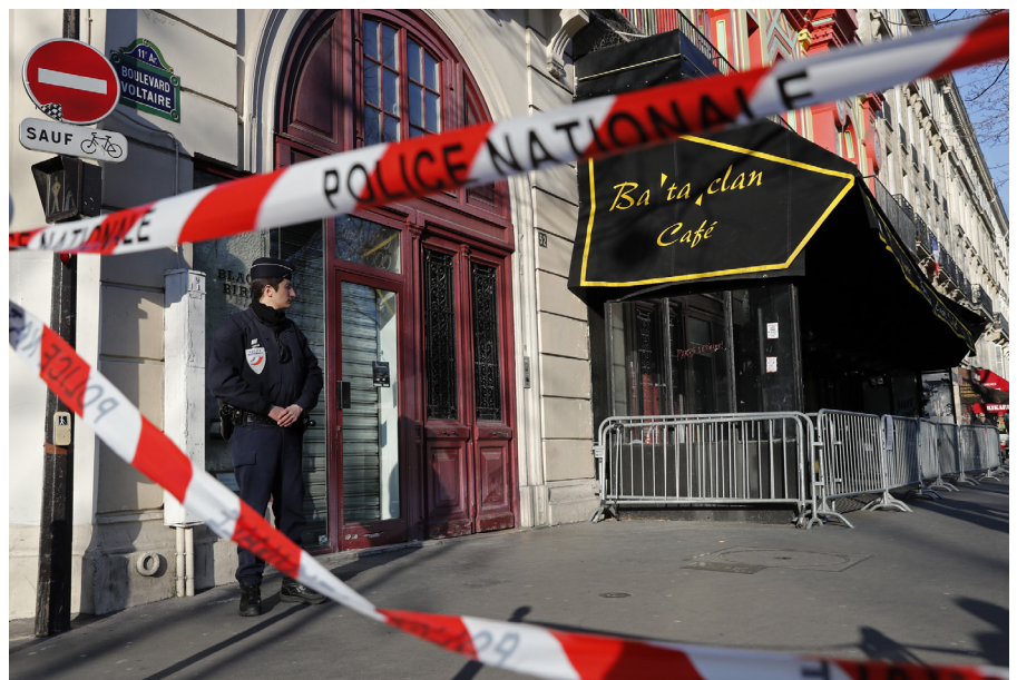
Die Anschläge in Paris und Brüssel zwischen 2014 und 2016 verdeutlichten auch für die Schweiz die von Dschihadrückkehrern ausgehenden Gefahren.

Die Mehrheit dieser Kämpfer stammt aus arabischen Ländern, insbesondere aus Tunesien und Saudi-Arabien. Doch auch aus westlichen Ländern sind seit 2011 zwischen 5000 und 7000 Dschihadkämpfer nach Syrien und in den Irak gezogen, darunter über 900 aus Frankreich sowie rund 760 aus Grossbritannien, 760 aus Deutschland oder 470 aus Belgien. Bei diesen Zahlen handelt es sich meist um Schätzungen. Zudem erschweren unterschiedliche Erhe-