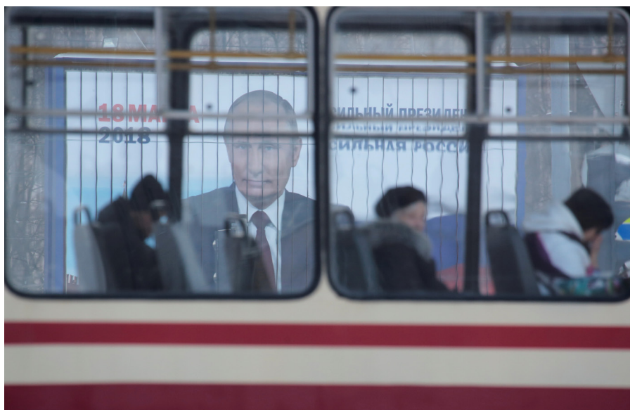
Vladimir Poutine a été réélu lors des élections présidentielles du 18 mars 2018.

À cet égard, les sanctions économiques imposées en 2014 par les pays occidentaux ont plutôt fait le jeu du régime. Pour Mos-