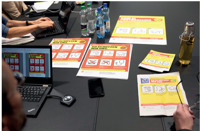
Das Bundesamt für Gesundheit startet Ende Februar 2020 eine Informationskampagne zur Eindämmung des neuen Coronavirus.

Ein Modell bildet immer nur eine von vielen möglichen Interpretationen der zukünftigen Entwicklung ab. Je nachdem, auf welchen Annahmen ein Modell beruht, können zwischen unterschiedlichen Modellen und ihren Prognosen teils grosse Diskrepanzen entstehen. Solche Diskrepanzen sind nicht per se schlecht, sondern können im Gegenteil dazu dienen, eine Bandbreite von möglichen zukünftigen Entwicklungen aufzuzeigen. Diese Bandbreite kann dann zur Basis von politischen Entscheidungen