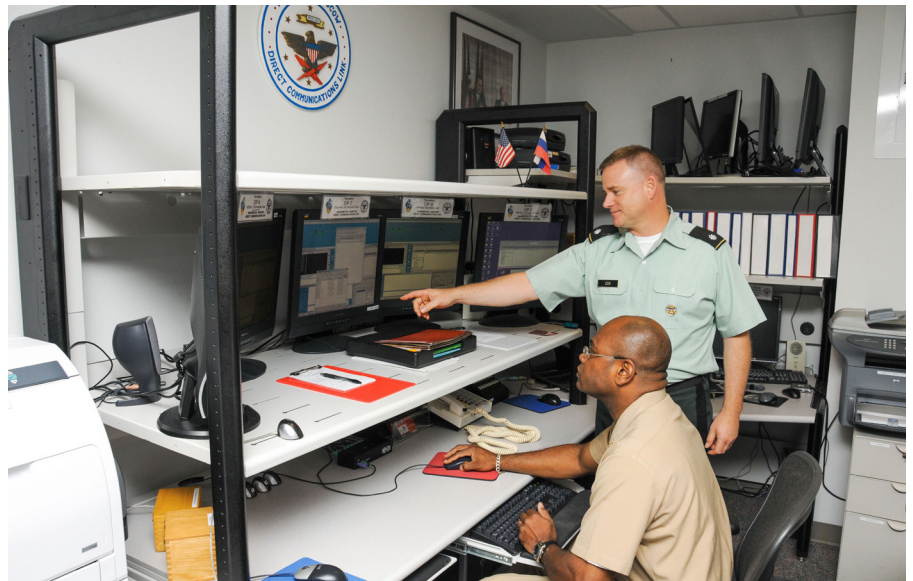
Le communicateur présidentiel et le traducteur présidentiel principal assurent la permanence téléphonique en 2013.

De façon générale, cette approche fait référence aux mécanismes contribuant à diminuer les risques de recours à l'arme nucléaire, que ce soit de manière intentionnelle dans le cadre d'une stratégie d'État ou d'une situation d'escalade, ou non intentionnelle du fait d'un déclenchement