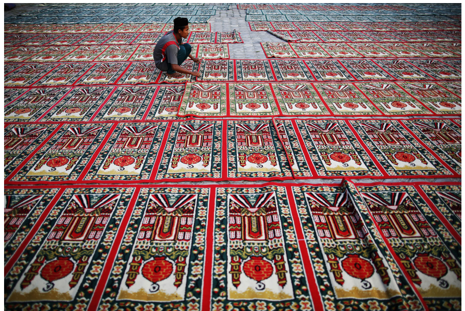
Ein Mann bereitet vor einer Moschee in Banda Aceh Teppiche für muslimische Gläubige vor. Indonesien ist das bevölkerungsreichste muslimische Land der Welt.

Der neue Präsident wird ein Land mit grossem Potenzial anführen: Indonesien ist die grösste Wirtschaftsmacht in Südostasien. Das einzige G20-Mitglied in der Region verzeichnet ein beständiges Wirtschaftswachstum. Mit 253 Mio. Einwohnern ist Indonesien das viertgrösste Land der Welt. Die wachsende Mittelschicht kurbelt den Verbrauchermarkt an. Indonesien ist aufgrund seiner strategisch günstigen Lage an einer der befahrensten Seeschiffahrtsstrassen der Welt sowie zwischen dem Indischen Ozean und dem Pazifik ein wichtiger Partner für alle Staaten mit geopolitischen Ambitionen in der Region. Seit 2005 baut Jakarta seine strategischen Partnerschaften mit den USA, China und Indien aus und vertieft die Zusammenarbeit mit Australien. Darüber hinaus spielt das Land eine führende Rolle innerhalb des Verbandes Südasiatischer Nationen (Asean), ist Mitglied des Ostasiengipfels und des Asia-Pazifischen Wirtschaftsforums.